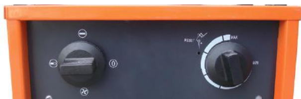
Regulador de potencia